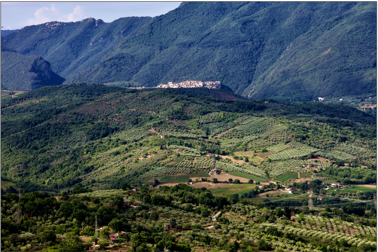
RAPPORTO PAESAGGIO NATURALE/INSEDIAMENTO ANTROPICO/PAESAGGIO ARTIFICIALE